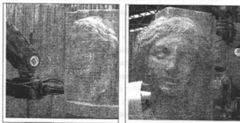
Рис.2. Различные стадии изготовления копии мраморной скульптуры с помощью фрезерного станка с ЧПУ

постепенно, сначала очень грубо, а с каждым новым шагом (по мере замены используемых фрез на инструменты меньшего размера) – все точнее и точнее, фрезеровать глыбу камня, в результате чего на свет появляется высокоточная копия исходного объекта (рис. 2).