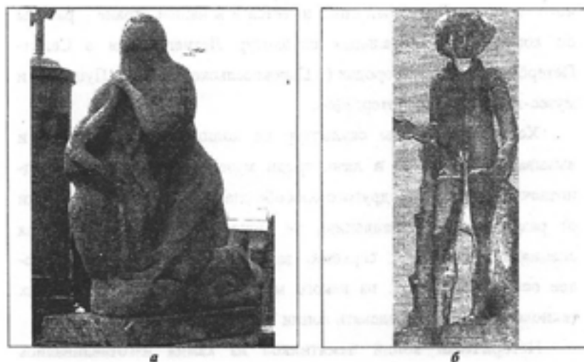
Рис.1. Фотографии разрушающихся мраморных скульптур в Некрополе XVIII в. Александро-Невской Лавры (а) и в саду Боболи во Флоренции (б)

В этой ситуации на повестку дня уже давно встал вопрос о необходимости постепенной замены каменных скульптур, находящихся в экстерьерных условиях, на копии с последующим переносом оригиналов в интерьеры музеев. Как показывает мировая практика, это единственная возможность сохранить для потомков творения мастеров прошлого, по крайней мере, наиболее ценные из них. Именно по этому пути уже давно пошли в Италии и других странах Европы. Самый известный пример такого подхода к сохранению памятников это история шедевра Микеланджело – скульптуры Давида, которая простояла почти 370 лет на площади Синьории во Флоренции. В 1873 году эта скульптура была скопирована, в результате чего оригинал Давида переехал на вечное